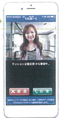
スマートフォン (Android / iPhone)

※インターネットをご利用いただきますので、プロバイダのご契約が必要です（別途月額利用料などがかります）。