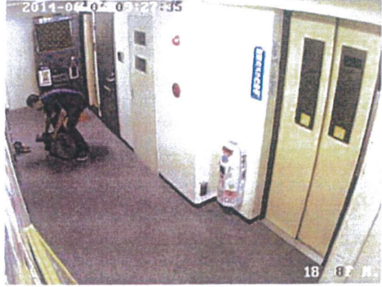
取った靴を自分のかばんの中に入れていきます。 2014-06-07 09:27:38