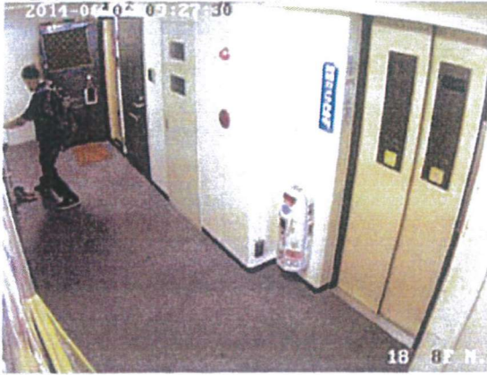
業者様の靴を取っています。 2014-06-07 09:27:35